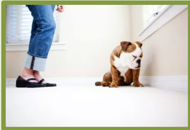
保持良好關係，不要因小失大