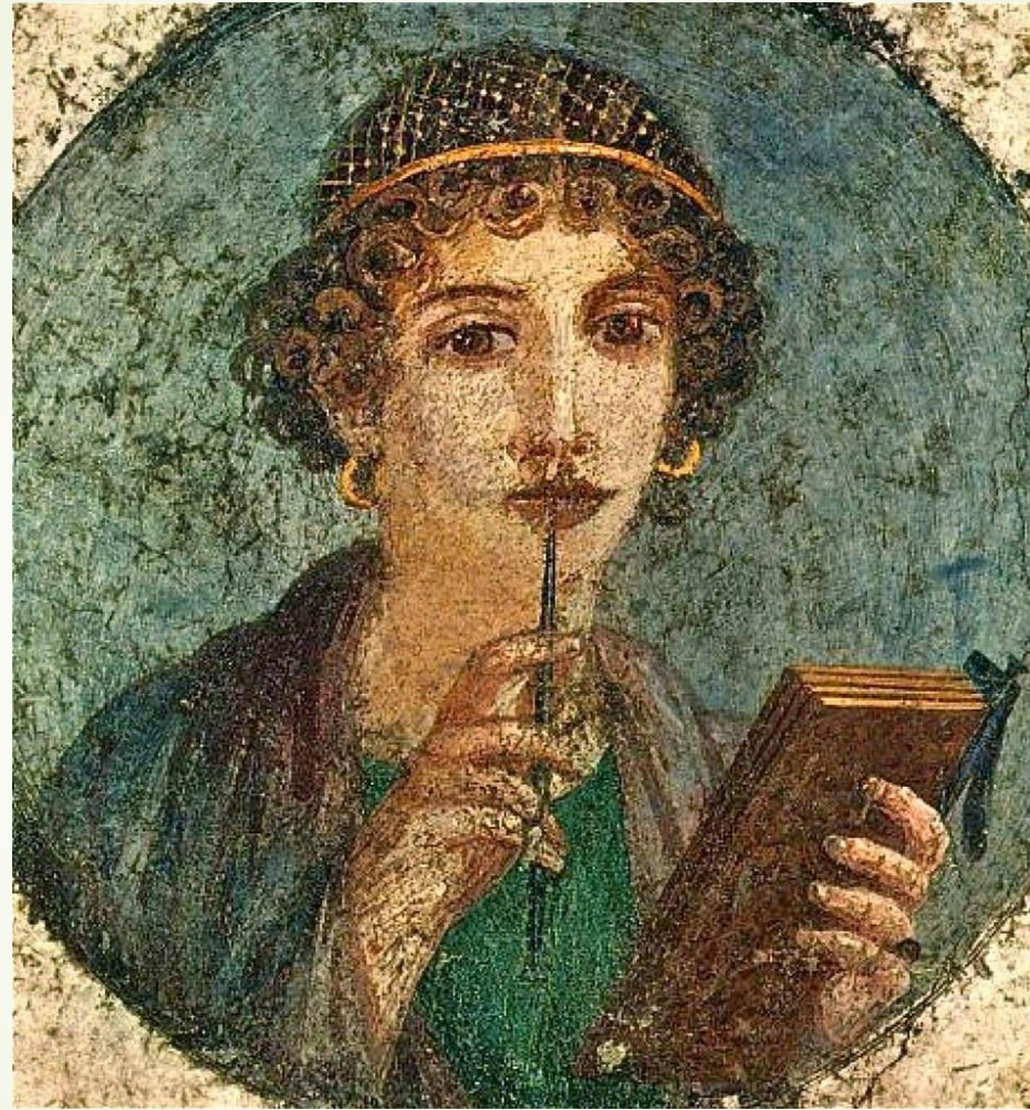
龐貝城壁畫上一位精心打扮的羅馬婦女。