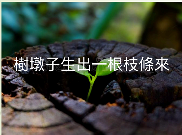
樹墩子生出一根枝條來

4:2-4 到那日，耶和華發生的苗必華美尊榮，... 主以公義的靈和焚燒的靈將錫安女子的污穢洗去，又將耶路撒冷中殺人的血除淨。那時，剩在錫安留在耶路撒冷的，... 必稱為聖。