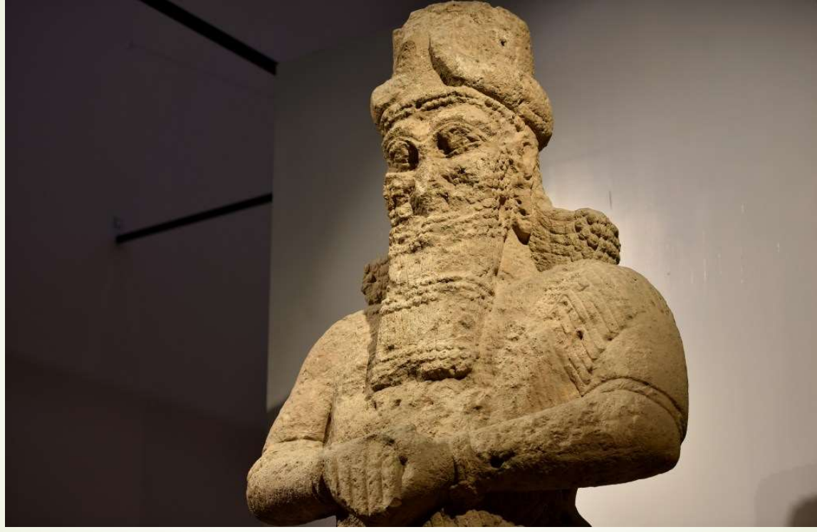
出土于宁录的主前8世纪纳布（Nabu）神雕像，现存于伊拉克博物馆。纳布的希伯来语是尼波（Nebo），