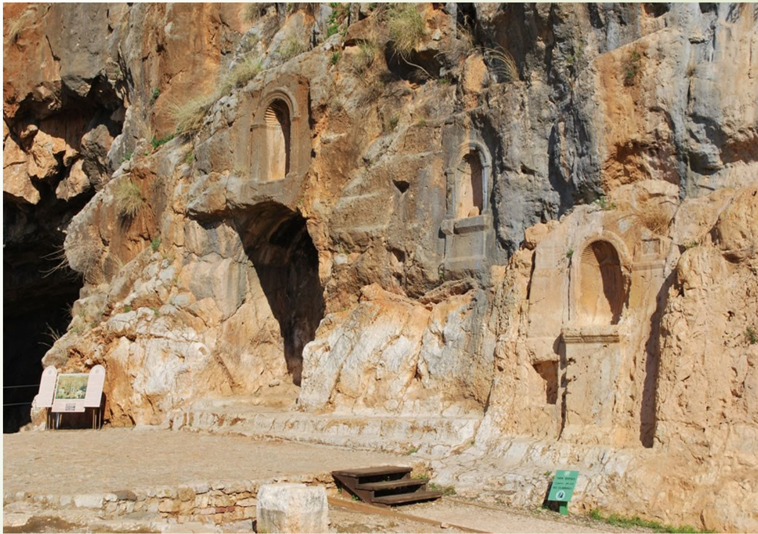
凯撒利亚腓立比遗迹，至今可见岩壁上刻着大大小小的偶像神龛。