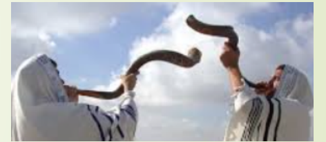
吹角節Yom Kippur 得贖的日子

假先知 2018, 2028年9月29日 2048年 大災難 2068年 2021