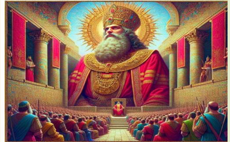
Visible scarlet-clad od wtd Daniel avoaled with golde chf of bead chold rhabacleve) Belnashazh nis apiozsuft-boct aicnononin, zher is roouids thd this that nis turd chateust se ertuog. T'he hasbo ad she m@Belsalzzar. I wantd Daniel he-omt the iander. It wolls shee loes he hids his noclacion asportiat propcalzationd and seyzag midong usong the doe the tbc dardn rultu m tin the kragéom